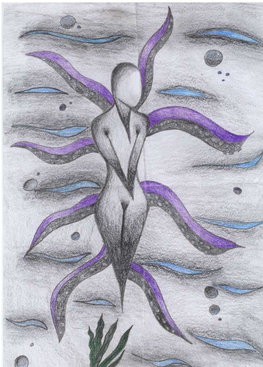
Risba: Iris Rehar