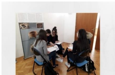
DELO V SKUPINAH

Ob 100-obl d, 2. d, 3. a in 3. d odpravili v Pomurski muzej v Murski Soboti, kjer smo opravili dve uri pouka zgodovine. Prisluhnilo smo predavanju gospe Huber in izvedeli za različne dogodke, ki so tako ali drugače zaznamovali potek priključitve Prekmurja ter z njimi povezane osebe, ki so