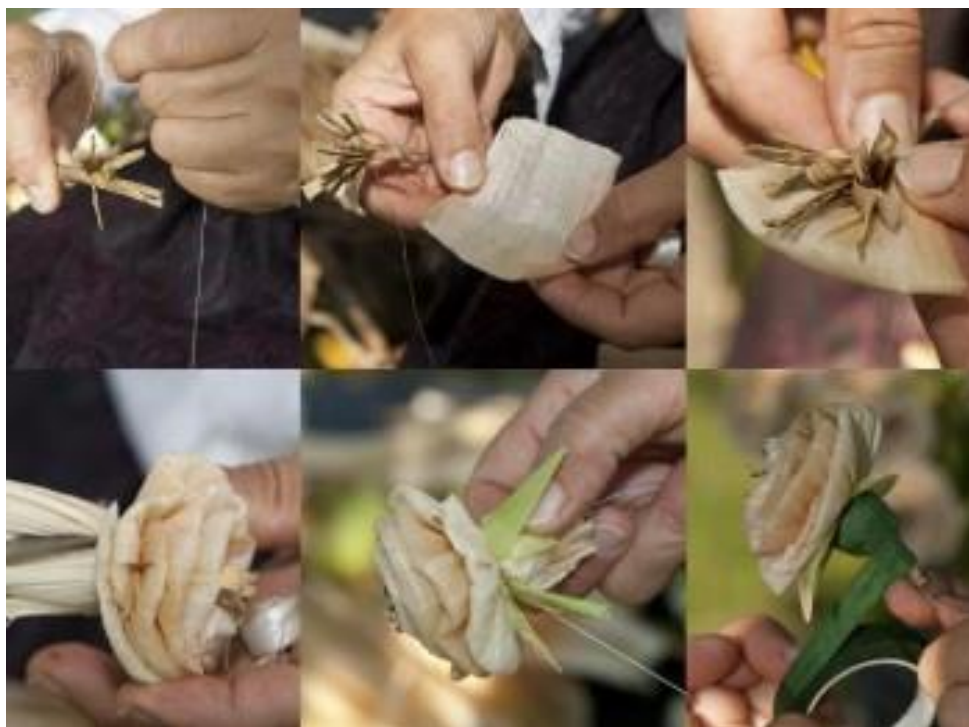
Slika 12: Pletenje iz ličja