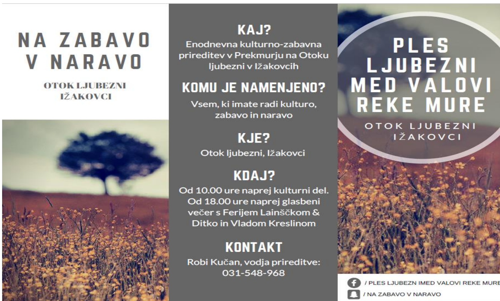
Slika 5: Brošura za prireditev (zunanja stran)