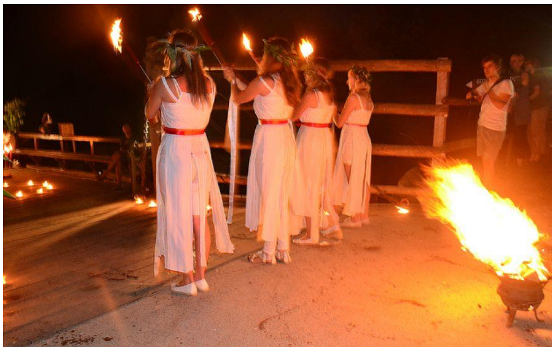
Slika 10: Ples Mürskih vil