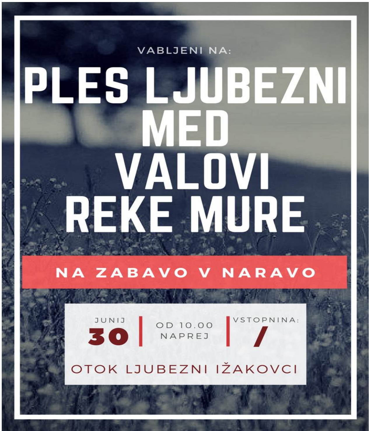
Slika 3: Letak za prireditev (sprednja stran)