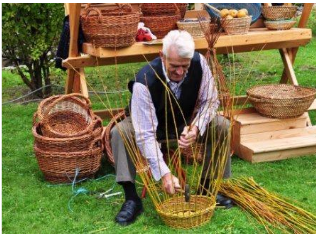
Slika 13: Pletenje košar