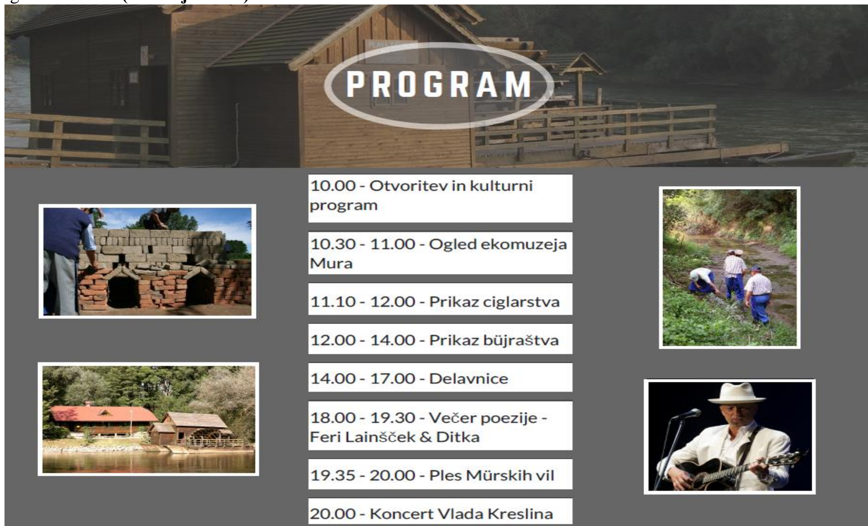
Slika 6: Brošura za prireditev (notranja stran)