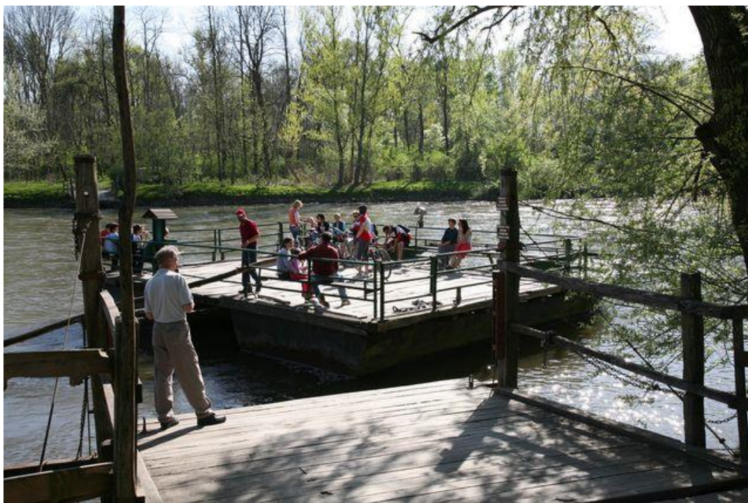
Slika 8: Vožnja z brodom