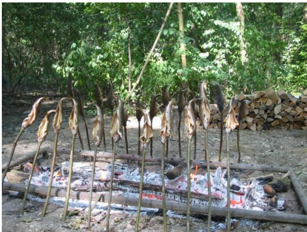
Slika 9: Pečenje rib na "indašnji" način