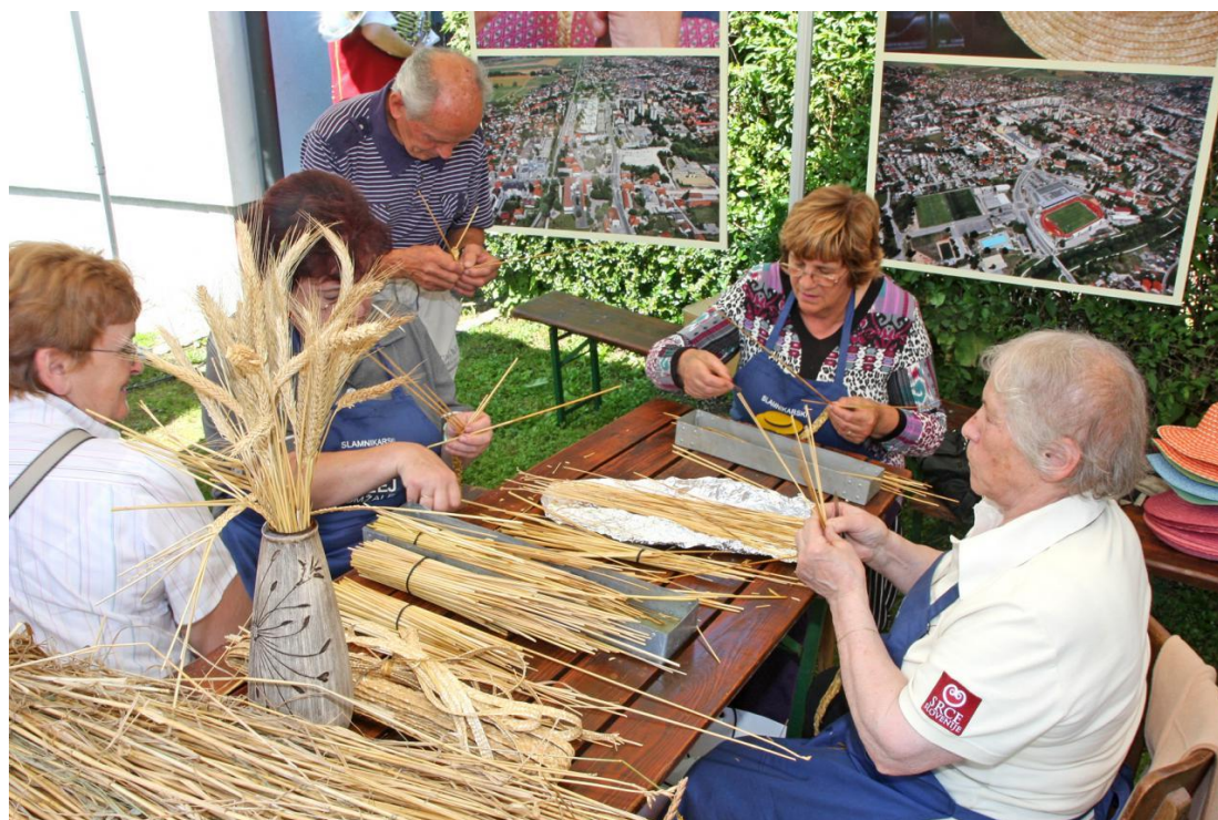
Slika 11: Pletenje iz slame